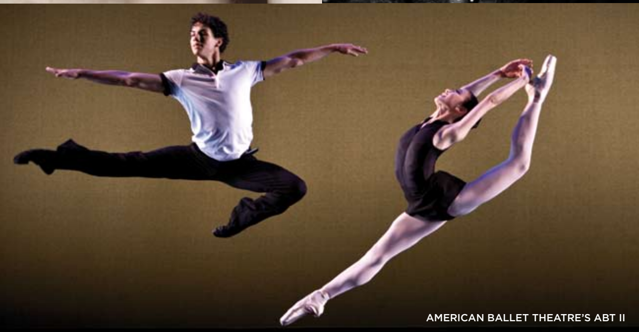
AMERICAN BALLET THEATRE'S ABT II